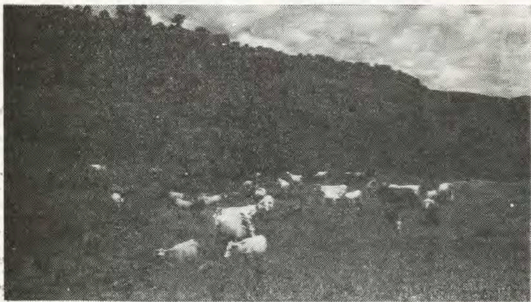
Uma paisagem no interior do município.